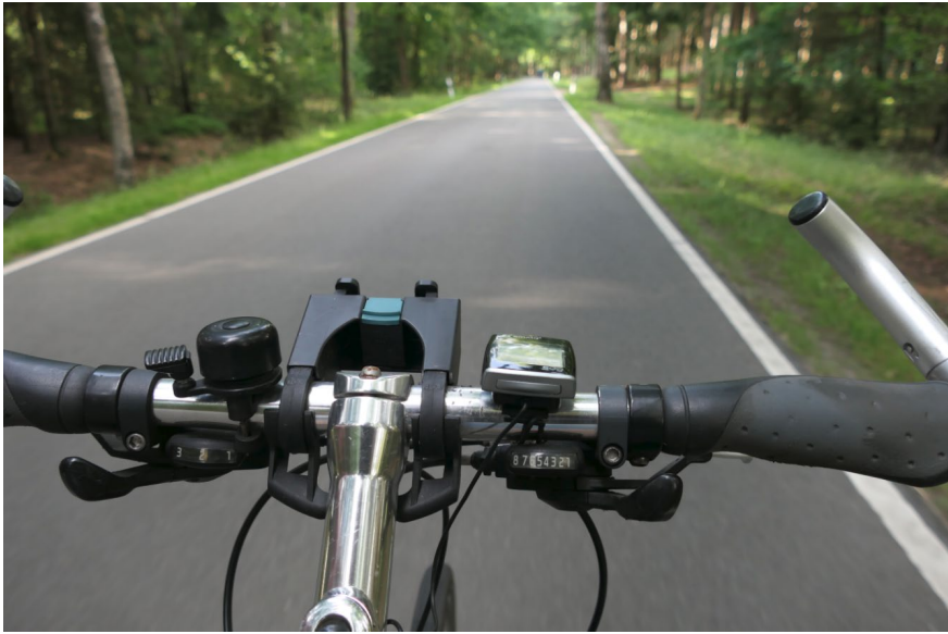
Radfahren im Naturpark Lüneburger Heide